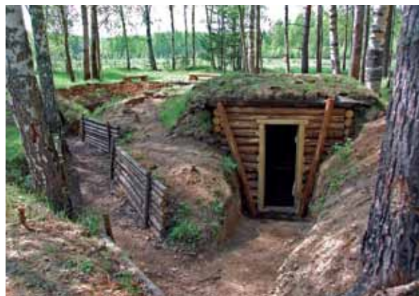
Блиндаж и окоп на переднем крае обороны советских войск («Павловский плацдарм»)

грамотами различных ведомств, медалями «60 лет Победы», «Патриот России», «В память о народном ополчении». В 2010 году ему присвоено звание «Заслуженный эколог Российской Федерации».