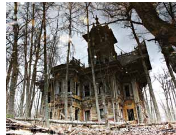
Терем, 2008 год

Восстановление терема началось в 2011 году и стало одним из самых сложных проектов в области деревянной реставрации в России. Терем был разобран, затем собран обратно с заменой 40% сгнивших брёвен. Изготовлены несколько тысяч деталей резьбы на замену утраченным. Восстановление некоторых элементов декора потребовало исследования старых фотографий, чертежей, следов, оставленных утерянными элементами резьбы на брёвнах сруба. Использовали историче-