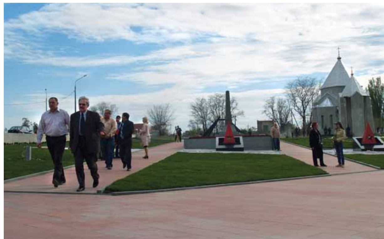
Мемориал в совхозе Красный

Лауреат премии Автономной Республики Крым (1998), премии Совета министров Автономной Республики Крым (2000). Магистр государственного