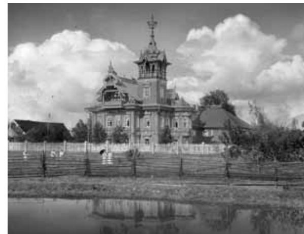
Терем, начало XX века

В 1942 году положение поменялось, и в Терем въехали правление совхоза, медпункт, клуб, почта, библиотека — всем нашлось место. Не смогли, правда, справиться с мудрёным печным отоплением. Сазонов в свое время заказал себе печки по финским каталогам. Говорили, что дымоходы были сложены так затейливо, что дым над крышей появлялся спустя 4 часа после того, как печи бывали затоплены. Все это пришло в негодность к сороковым годам,