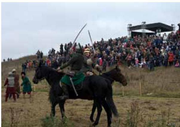
На Дне памяти Великого стояния на Угре 1480 года